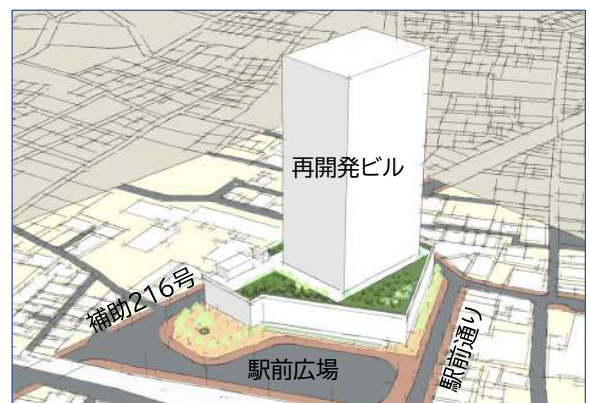
駅前広場上空からのイメージ